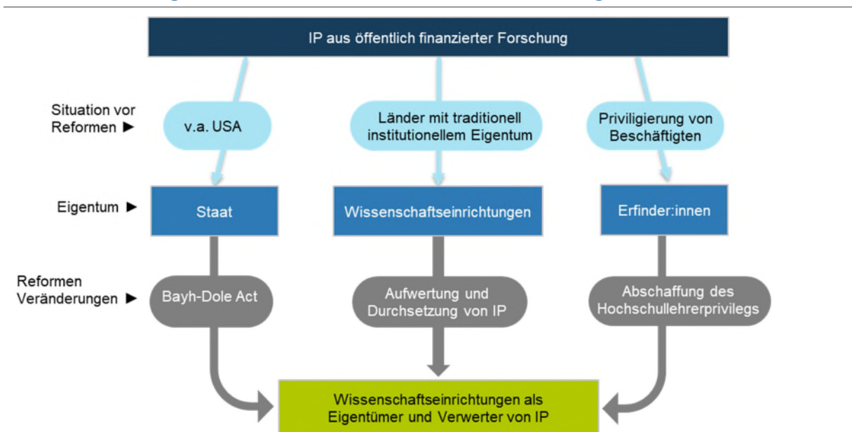
Grafik 2 Eigentum an IP aus öffentlich finanzierter Forschung vor und nach Reformen

Der Bayh-Dole Act und die durch ihn ausgelösten Einnahmesteigerungen bei der Verwertung von geistigem Eigentum in den USA löste Diskussionen in zahlreichen Industriestaaten aus. Das Thema Verwertung der Ergebnisse aus öffentlicher Förderung rückt in den Fokus der Politik und es kam z.T. zu Änderungen bei den Eigentumsrechten. Grafik 2 verdeutlicht, dass Neuregelungen von Eigentumsrechten die Stellung von Wissenschaftseinrichtungen aus zwei Richtungen veränderten.